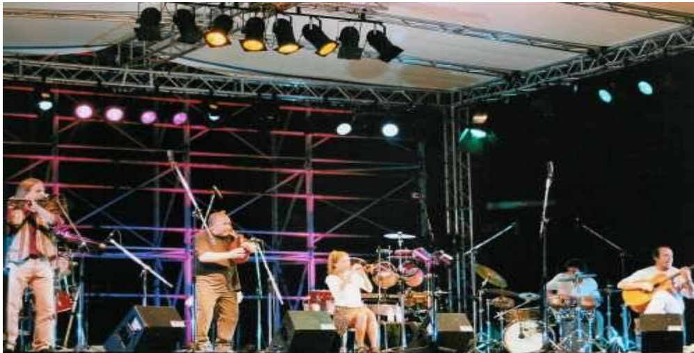
Loar gan sur scène pendant leur tournée en Italie.